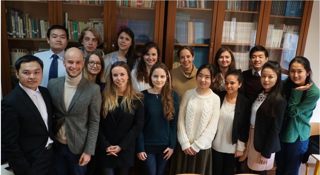
→ La promotion 2017-2018 du Master Droit Chinois des Affaires

Le stage de 3 à 6 mois de préférence en Chine en immersion dans le monde des affaires chinois constitue une partie importante de la formation.